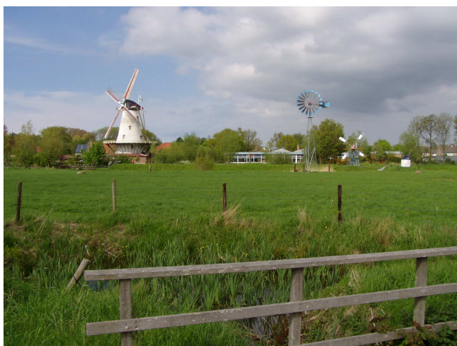
Molens van Haamstede