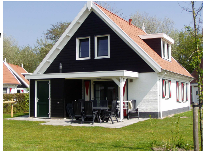
de achterkant van het huis.