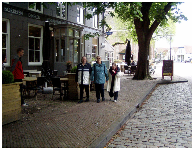
Wandelen in Haamstede