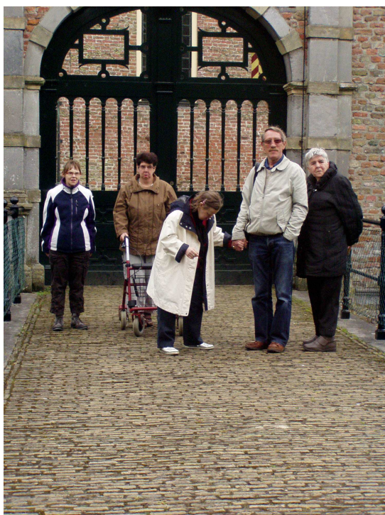
Voor het kasteel